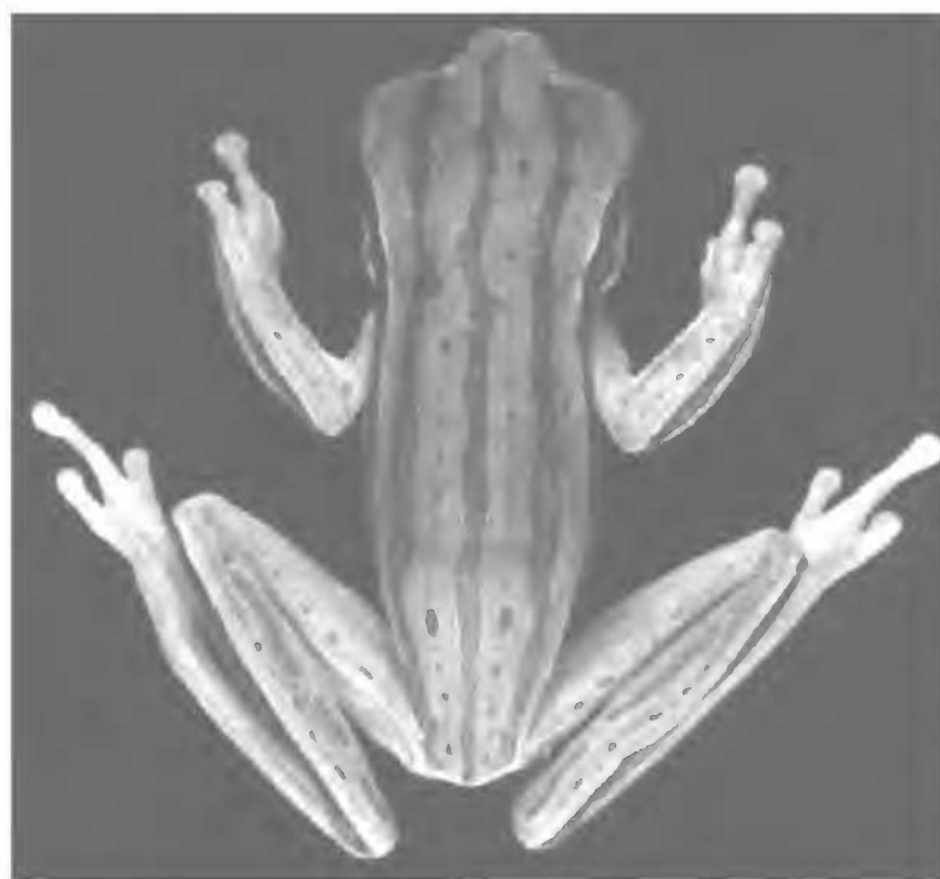
Fig.6- Hyla beckeri sp.nov., holótipo (MNRJ 14998; CRC 27,5mm), vista dorsal.

Descrição – Aspecto esbelto (Fig.6); comprimento da cabeça pouco maior que a largura, que cabe cerca de três vezes no comprimento total; focinho arredondado em vistas dorsal e lateral (Figs.7-8); narinas não protuberantes, elípticas, situadas e dirigidas lateralmente; distância internasal igual a distância narina-olho e a largura da pálpebra superior, que, por sua vez, equivale a 73% da distância interorbital; olhos proeminentes, situados lateralmente, dirigidos para frente; diâmetro do olho 1,4 vezes a distância narina-olho e cerca de 2,2 vezes o diâmetro do tímpano; canto rostral arredondado; região loreal oblíqua, ligeiramente côncava; saco vocal desenvolvido, subgular, único; dentes vomerianos em dois grupos pequenos, entre e ligeiramente atrás das